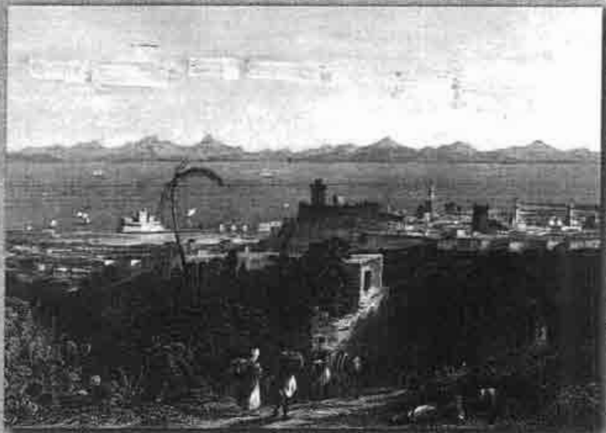
Γραβюра του 1826 των W. Wallis και W.H. Burleigh: VIEWS FROM HEIGHTS NEAR SIR SIDNEY SMITH'S VILLA.

Οι Προπτυχιακές και Μεταπτυχιακές Σπουδές στο Παιδαγωγικό Τμήμα Δημοτικής Εκπαίδευσης του Πανεπιστημίου Αιγαίου